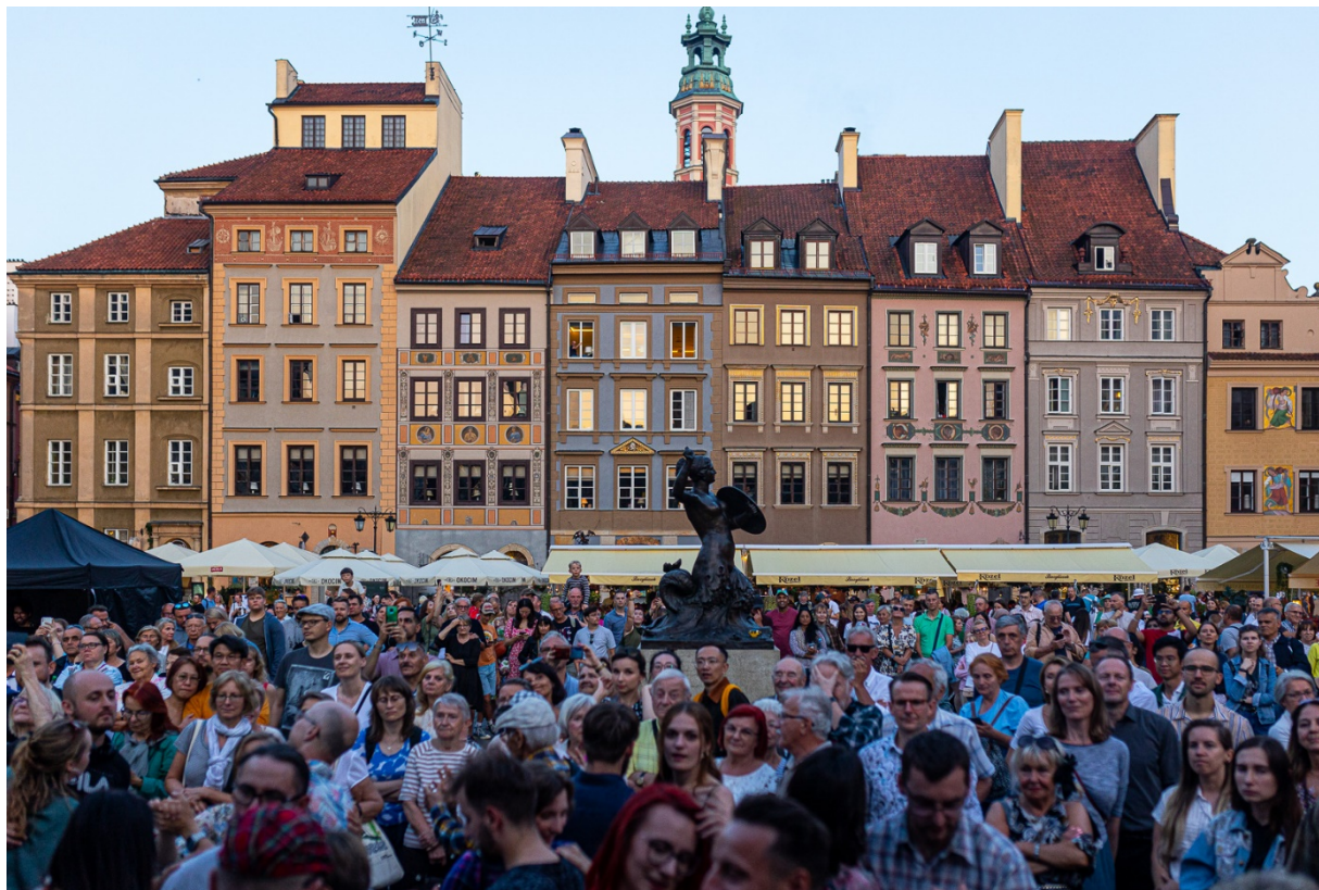
70. Urodziny Starówki.

Warszawskie Stare Miasto i okolice, 19–21.07.2024