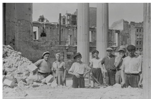
Pracownicy brygad odgruzowujący ruiny kościoła św. Aleksandra na placu Trzech Krzyży, 1945