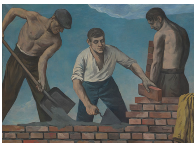
Wojciech Fangor, Murarze , 1950, Muzeum Warszawy