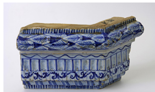
Kafel gzymsowy narożny, XVII-XVIII w., Muzeum Warszawy