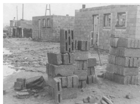
Reportaż z budowy eksperymentalnych domków gruzobetonowych Instytutu Badań Budownictwa na Polu Mokotowskim, 1948