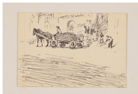
Marek Żuławski, Odgruzowywanie Warszawy, 1946, Muzeum Warszawy