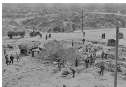
Odgruzowywanie getta, 1947