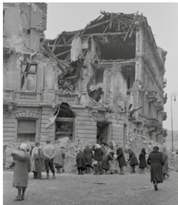
Ul. Krucza, Początki odgruzowywania, 1945, fot. Zofia Chomętowska, Muzeum Warszawy