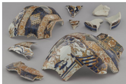
Fragmenty wazy porcelanowej (XVII–XVIII w.) wydobyte z gruzów w latach 1950–1953, kolekcja Barbary Bazińskiej, Muzeum Warszawy, fot. A. Czechowski