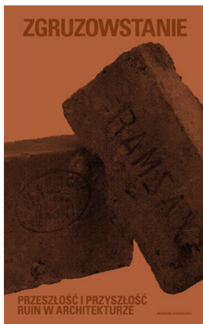
Okładka książki, proj. Kaja Kusztra