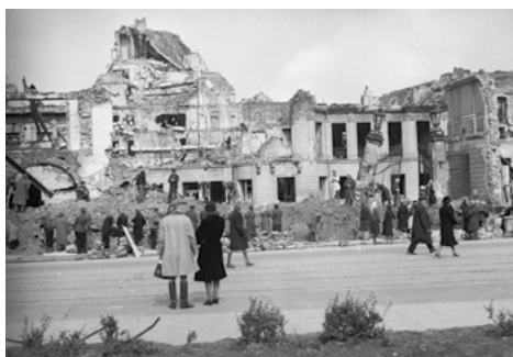
Akcja odgruzowywania pałacu Blanka na placu Teatralnym, 1945