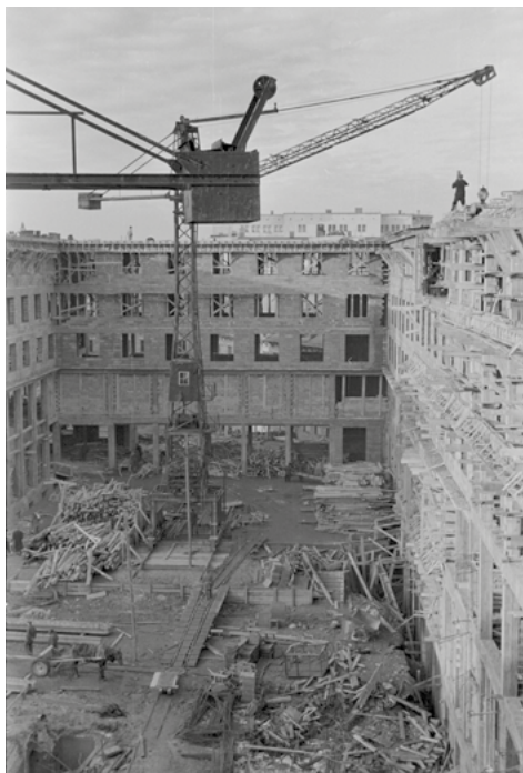
Budowa gmachu Ministerstwa Przemysłu i Handlu i Państwowej Komisji Planowania Gospodarczego, 1948, fot. Alfred Funkiewicz, Muzeum Warszawy