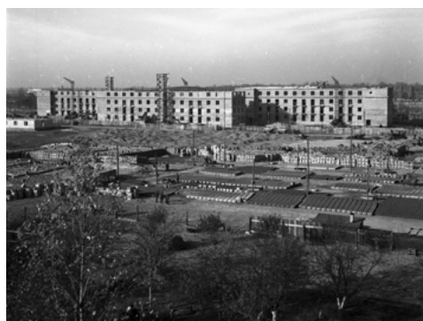
Osiedle WSM Koło II w budowie, na pierwszym planie poligon prefabrykacji, zdjęcie zrobione z góry Moczydłowskiej usypanej z gruzu, 1948