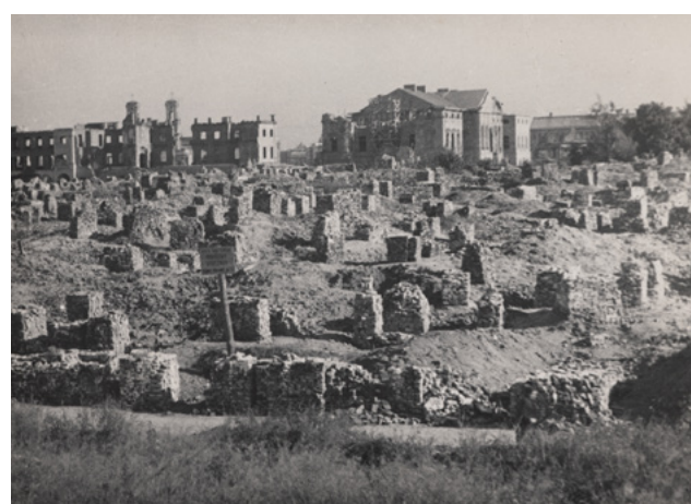
Widok na tzw. kozły cegieł ustawione podczas odgruzowywania ul. Nalewki, 1949, fot. Jan Bułhak, Muzeum Warszawy