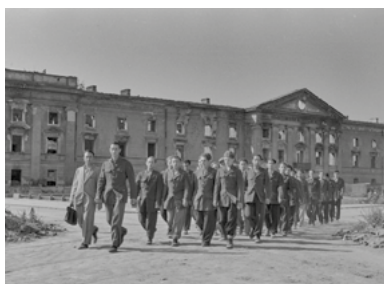
Mężczyźni z organizacji żydowskiej przy odgruzowywaniu terenu getta, 1947, fot. Alfred Funkiewicz, Muzeum Warszawy