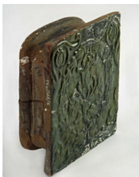
Kafel płytowy, prawd. XVII w., Muzeum Warszawy