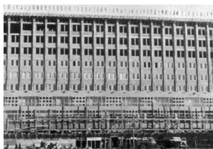
Dom PKO przy ul. Marszałkowskiej, 1948, NAC