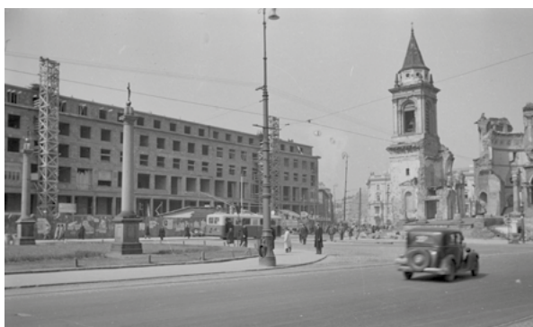
Plac Trzech Krzyży. Budowa gmachu Ministerstwa Przemysłu i Handlu Państwowej Komisji Planowania Gospodarczego, 1948