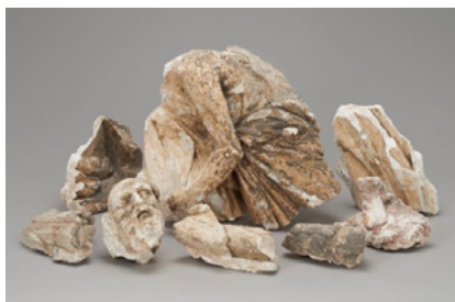
Paweł Maliński, Postać starca – fragment fryzu z Teatru Wielkiego, Muzeum Warszawy