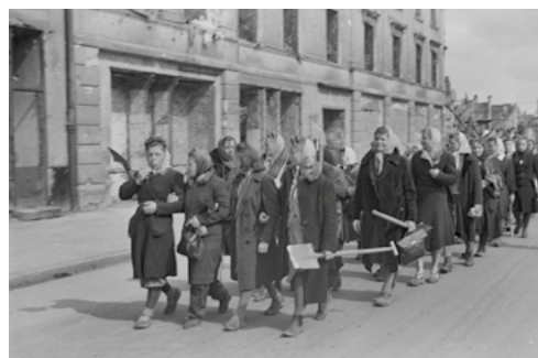
Brygada Pracy w drodze na akcję odgruzowywania, 1945