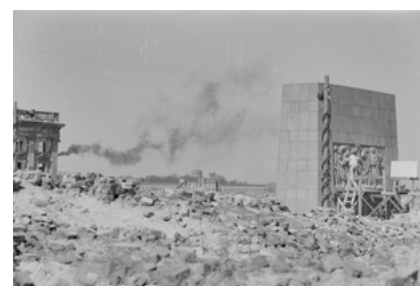
Pomnik Bohaterów Getta, 1947, fot. Alfred Funkiewicz, Muzeum Warszawy