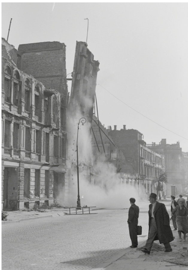
Rozbiórka domów na ul. Wilczej, 1946