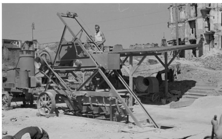
Reportaż z produkcji pustaków gruzobetonowych w Państwowym Przedsiębiorstwie Rozbiórki i Gospodarki Gruzem, 1947, fot. Alfred Funkiewicz, Muzeum Warszawy