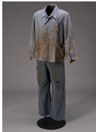
Strój robotnika z okresu odbudowy, aut. nieznane, ok. 1950