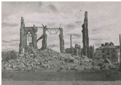
Pocztówka z cyklu Warszawa oskarża , Ruiny kościoła św. Floriana na Pradze, 1945, aut. nieznanne, Muzeum Warszawy

Historyk i badacz architektury. Za pracę poświęconą historii przemiany powojennych gruzów w architekturę i krajobraz Warszawy uzyskał stopień naukowy doktora University of Manchester (2022). Obecnie związany z Université de Fribourg. Stypendysta Bauhaus Foundation w Dessau (2018) i Deutsches Historisches Institut Warschau (2020). Kurator wystawy Do zobaczenia po rewolucji! w Galerii Arsenał w Białymstoku (2019). Jego zainteresowania naukowe koncentrują się wokół przemian materialności dwudziestowiecznej architektury, a także ekonomii cyrkularnej w budownictwie współczesnym i historycznym.