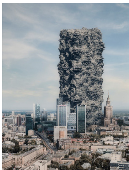
Tymek Borowski, Gruz nad Warszawą, 2015, Muzeum Warszawy