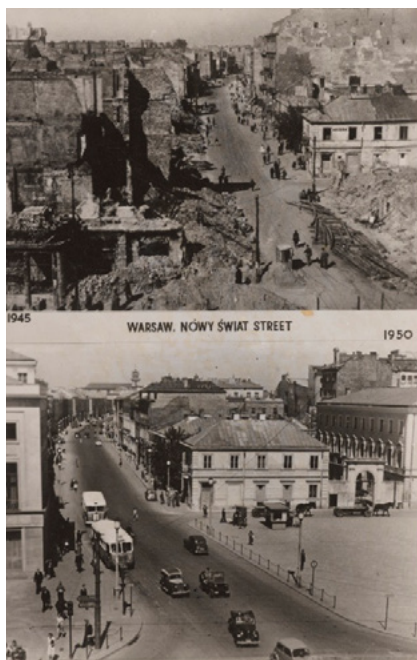
Pocztówka, ul. Nowy Świat w 1945 i 1950 r., aut. nieznane, Muzeum Warszawy