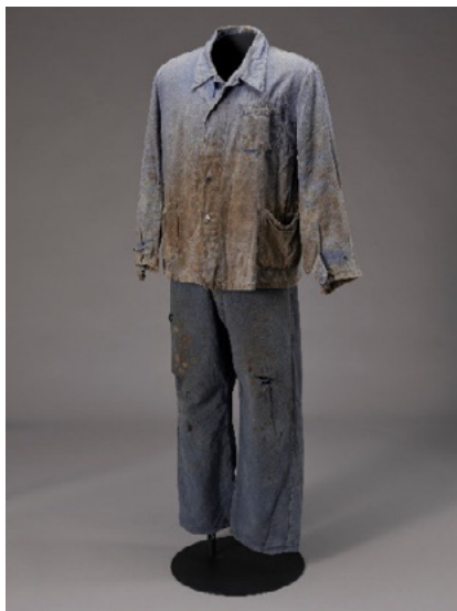
Strój robotnika z okresu odbudowy, aut. nieznanne, ok. 1950, fot. A. Czechowski