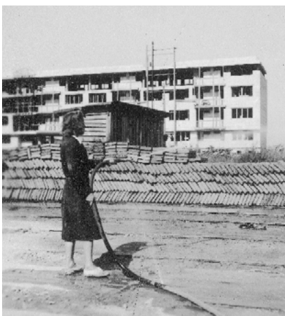
Budowa osiedla WSM Koło II, produkcja pustaka gruzobetonowego, Socjalistyczna Agencja Prasowa, 1948, NAC

salach ruiny odżywają, toczy się codzienne życie, zaczynają się także pierwsze rozbiórki i akcje sprzątania – prowadzone w dużej mierze przez kobiety z Brygad Pracy. Cegła rozbiórkowa staje się bezcennym skarbem, przyjeżdża też do Warszawy z Wrocławia, Szczecina i innych miast zachodnich części Polski w jej nowych granicach. Wynaleziony zostaje gruzobeton i szybko podejmowane są próby zastosowania go w praktyce, jak przy budowie osiedla Koło II czy monumentalnego gmachu dzisiejszego Ministerstwa Rozwoju i Technologii przy placu Trzech Krzyży. Wystawę zamyka szersze spojrzenie krajobraz przestrzenny Warszawy, który podczas odbudowy uległ nieodwracalnym zmianom, wciąż dostrzegalnym nie tylko w zabudowie czy linii ulic. Usypane z gruzu Kopiec Powstania Warszawskiego, Górka Moczydłowska czy Górka Szczęśliwicka to miejsca z jednej strony wrośnięte w miasto, a z drugiej obiekty, których zagospodarowanie czy przebudowy nadal wywołują dyskusje.