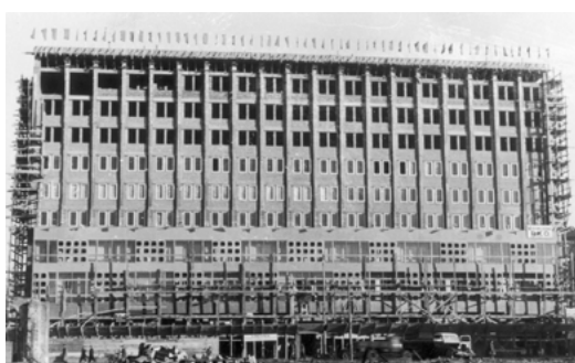
Dom PKO przy ul. Marszałkowskiej, 1948