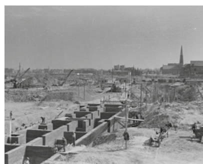
Plac Trzech Krzyży, 1947