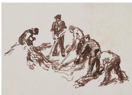
Marek Żuławski, Robotnicy przy odgruzowywaniu Warszawy, 1946, Muzeum Warszawy