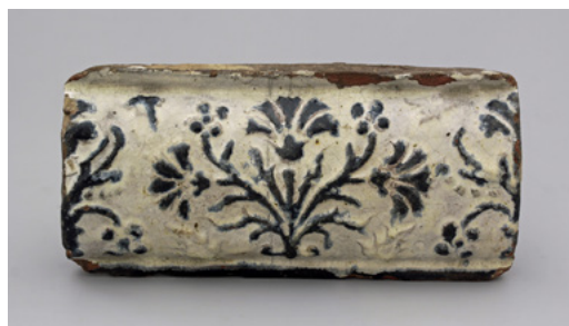
Kafel piecowy gzymsowy, XVII w., Muzeum Warszawy