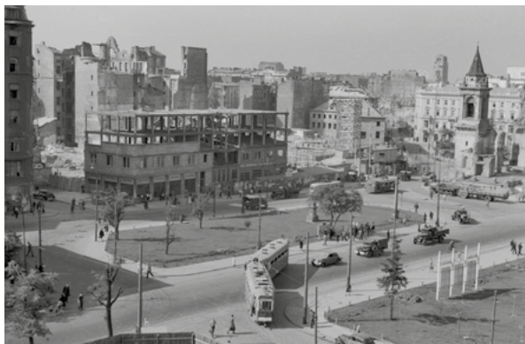
Plac Trzech Krzyży, 1947