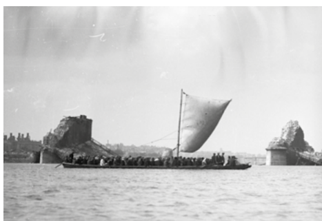
Przeprawa przez Wisłę, 1945