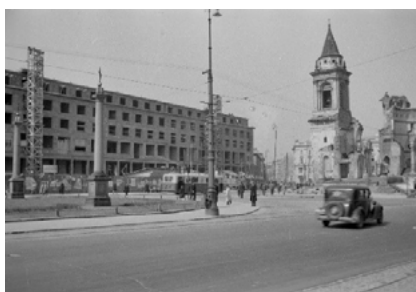
Plac Trzech Krzyży. Budowa gmachu Ministerstwa Przemysłu i Handlu Państwowej Komisji Planowania Gospodarczego, 1948