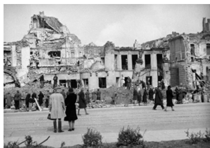
Akcja odgruzowywania pałacu Blanka na placu Teatralnym, 1945