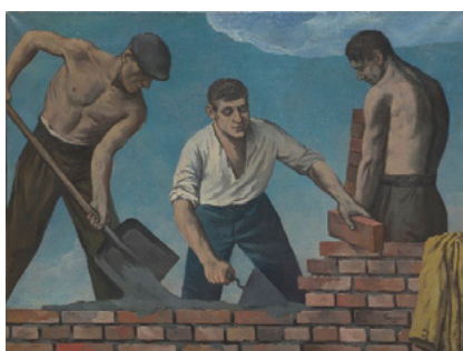
Wojciech Fangor, Murarze , 1950, Muzeum Warszawy