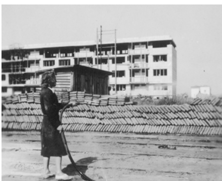
Budowa osiedla WSM Koło II, produkcja pustaka gruzobetonowego, Socjalistyczna Agencja Prasowa, 1948, NAC