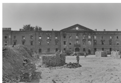
Zniszczony budynek koszar na terenie getta, 1947