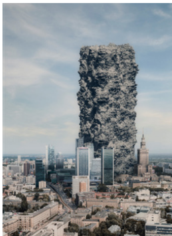
Tymek Borowski, Gruz nad Warszawą, 2015, Muzeum Warszawy