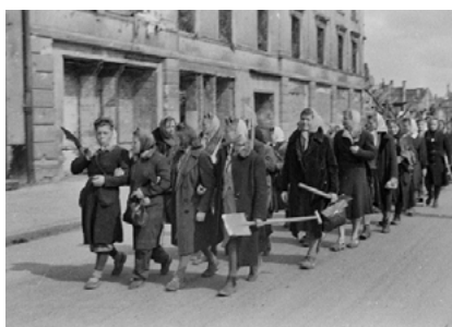
Brygada Pracy w drodze na akcję odgruzowywania, 1945