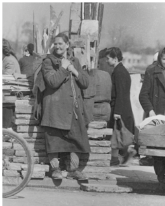
Przed przeprawą przez Wisłę, fot. Zofia Chomętowska, przed 1945, Muzeum Warszawy