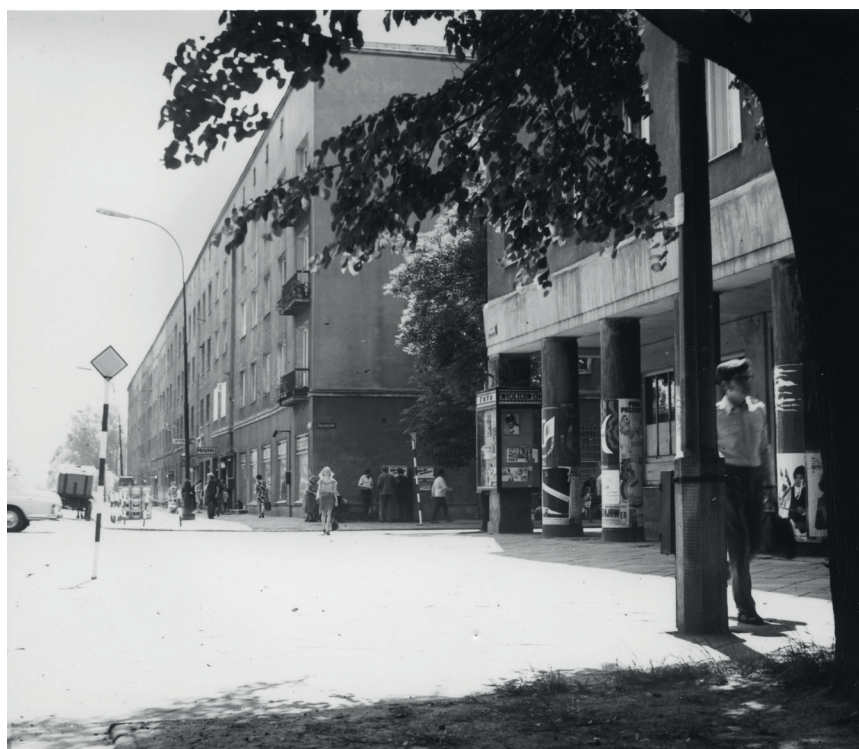
Budynek przy Francuskiej 1. W podcieniu widoczna gablota z fotografiami Celiny Osieckiej, fot. Andrzej Tytus Osiecki, po 1975 r.

Pytania o pliki w wysokiej rozdzielczości przeznaczone do publikacji oraz dodatkowe materiały prosimy kierować do Aleksandry Migacz tel. +48 22 277 43 45 e-mail: aleksandra.migacz@muzeumwarszawy.pl