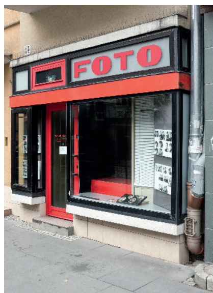
Bez tytułu (zakład fotograficzny przy ul. Zwycięzców 25) z cyklu „Fotograf Warszawski”, fot. Antonina Gugąta, 2016

Wystawa Celina Osiecka. Usługi fotograficzne to nie tylko prezentacja sylwetki wyjątkowej warszawianki, ale także dokument półwiecza historii rzemiosła fotograficznego, świadectwo zmian, które zaszły w dziedzinie fotografii, w kulturze, modzie i obyczajowości.