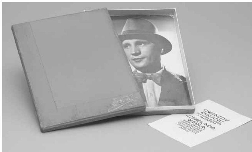
7. Pudełko po czekoladkach firmy E. Wedel z fotosem aktora René Lefevre'a, autorstwo nieznanne, wytw. nieznana, lata 30. XX w.; tektura, papier, papier fotograficzny; techniki intrologatorskie; wys. 2,2, dł. 17,5, szer. 23 cm; MHW 27412/a-c / E. Wedel chocolate box with a photograph of the actor René Lefevre, author unknown; producer unknown, 1930s; cardboard, paper, photographic paper, binding techniques; height: 2,2, length: 17,5, depth: 23 cm; MHW 27412/a-c

przez Karola Ernesta Wedla. Cukiernik przybył do Warszawy w 1845 roku, by pracować w zakładzie Karola Gronerta. Po sześciu latach usamodzielniał się i otworzył własny zakład cukierniczy przy ulicy Miodowej 484. W 1864 roku zakład ojca przejął syn Emil. On też rozszerzył działalność i w 1879 otworzył fabrykę przy ulicy Szpitalnej 8. Najbardziej popularny sklep firmy mieścił się na narożniku ulic Szpitalnej i Hortensji (obecnie Górskiego). Firma miała sieć sklepów w całej Warszawie, także w innych miastach oraz za granicą, w Paryżu, przy rue Vignon. W 1920 roku do prowadzenia rodzinnej firmy włączył się trzeci z Wedłów, Jan, syn Emila. To on rozpoczął w 1927 roku budowę nowego zakładu na Kamionku, przy ulicy Zamoyskiego. To tam od 1930 mieściła się główna siedziba firmy 7 .