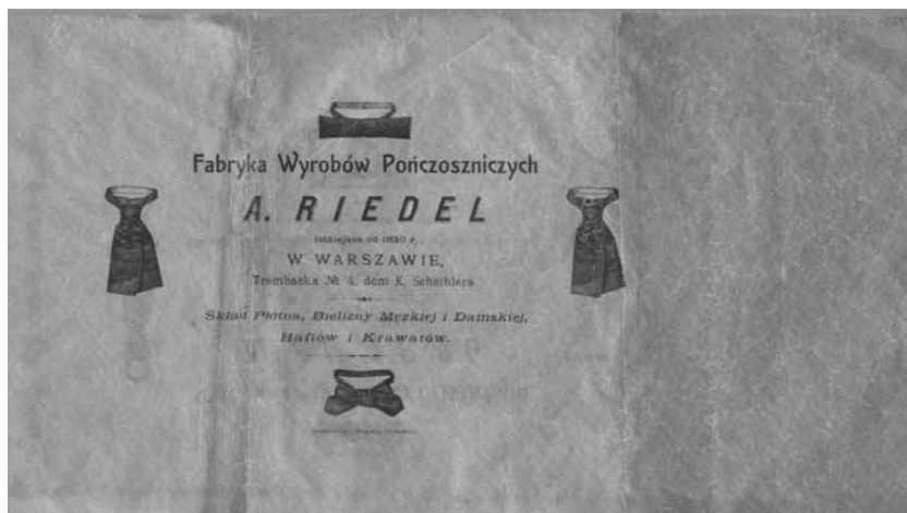
6. Torebka firmowa Fabryki Wyrobów Pończosznichych A. Riedel, autorstwo nieznanne, wytw. Jeremułowicz i Bergman, Sosnowice; pocz. XX w.; celofan; druk; wys. 19,8, szer. 37 cm; MHW 27272 / A. Riedel Hosiery Products Factory bag, author unknown, produced by Jeremułowicz & Bergman, Sosnowice; early 20th c.; cellophane, print; height: 19.8, width: 37 cm; MHW 27272

Jak zostało zaznaczone powyżej, największą część kolekcji opakowań w Muzeum Warszawy stanowią te związane z cukiernictwem: są to zarówno opakowania po słodyczach dużych, przemysłowych firm warszawskich (Wedel, Fuchs), jak i mniejszych zakładów cukierniczych i kawiarni (Fruziński, Lardelli, Lourse, Franboli, Domański). Z uwagi na jedną ze swoich funkcji – podarunek, najczęściej dla kobiety, jako wyraz uczuć – pudełka po czekoladkach, bombonierki, charakteryzują się dekoracyjnością.