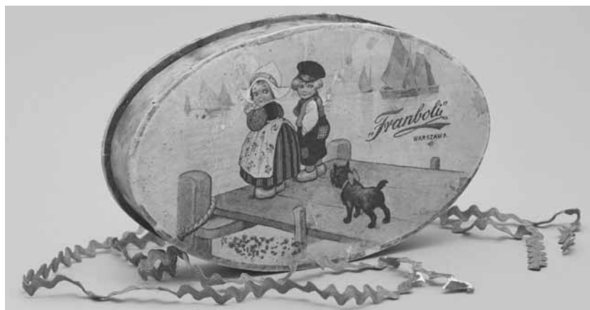
13. Pudełko owalne po czekoladkach firmy Franboli, autorstwo nieznane, wytw. nieznana; 1922–1939; tektura, papier; druk, klejenie; wys. 2,9, dł. 17,1, głęb. 10,4 cm; MHW 26269/a-c / Franboli oval chocolate box, author unknown, producer unknown; 1922–1939; cardboard, paper, print, glueing; height 2.9, length 17.1, depth 10.4 cm; MHW 26269/a-c

Muzeum i przygotowaniem nowej wystawy głównej, proces pozyskiwania nabytków do kolekcji opakowań nabrał dynamiki. W ciągu ostatnich dwóch lat kolekcja powiększyła się o ponad sto obiektów. Są wśród nich opakowania dawne, z okresu międzywojennego, i starsze, ale i znaczący odsetek obiektów współczesnych. Przyjrzymy się kilku przykładom.