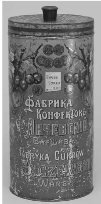
4. Pudło firmowe Fabryka Cukrów Franciszek Anczewski; autorstwo nieznanne, wytw. Fabryka Blachy Białej i Wyrobów Blaszanych Mieczysława Zbijewskiego, Warszawa; przed 1914; metal, ebonit, tłoczenie, cynkowanie, lakierowanie; wys. 33, śr. 15 cm; MHW 24203/a-b / Franciszek Anczewski Sugar Factory box; author unknown, produced by Mieczysław Zbijewski White Tin and Tin Product Factory, Warsaw, before 1914; metal, ebonite, embossing, galvanisation, coating; height: 33, diameter: 15 cm; MHW 24203/a-b

puszki po herbacie i kawie (kilkanaście pozycji). Zespół butelek po wyrobach alkoholowych z okresu międzywojennego to kolejny ważny zbiór, obok grupy opakowań po wyrobach przemysłowych – środkach chemicznych czy konfekcji i wyrobach galanteryjnych. Warto zwrócić także uwagę na butelki związane z produkcją warszawskiej branży mleczarskiej, mimo iż jest to jeden z najmniej licznych zespołów, obejmujący zaledwie kilka obiektów.