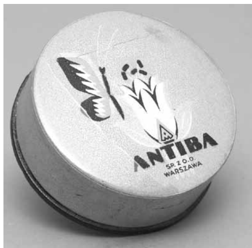
17. Opakowanie z pudrem „Antiba” firmy Ludwik Spiess i Syn; autorstwo nieznane; 1929–1939; tektura, papier, celofan, zawartość (puder); druk, klejenie, wyrób fabryczny; wys. 2,5, śr. 6,5 cm; MHW 27012 / Ludwik Spiess & Son Antiba powder box; author unknown; 1929–1939; cardboard, paper, cellophane, contents (powder); printing, glueing, factory-made; height 2.5, diameter 6.5 cm; MHW 27012

opodał, przy Ordynackiej 10. W 1961 roku powstaje w Warszawie pierwszy salon z modą męską „Adam” mieszczący się w budynku na rogu Świętokrzyskiej i Jasnej. W 1963 roku główny damski salon „Mody Polskiej” został przeniesiony do nowej siedziby przy ulicy Wiejskiej 20. W tym samym roku nowy adres zyskał też ośrodek wzornictwa – w nowo wybudowanym wieżowcu przy Tamce 49. Od 1967 roku główny salon przedsiębiorstwa mieścił się w Warszawie, przy ówczesnej ulicy Rutkowskiego (od 1990 ponownie Chmielnej). Sklepy „Mody Polskiej”, których w najlepszym okresie było blisko sześćdziesiąt, mieściły się we wszystkich większych miastach w Polsce.