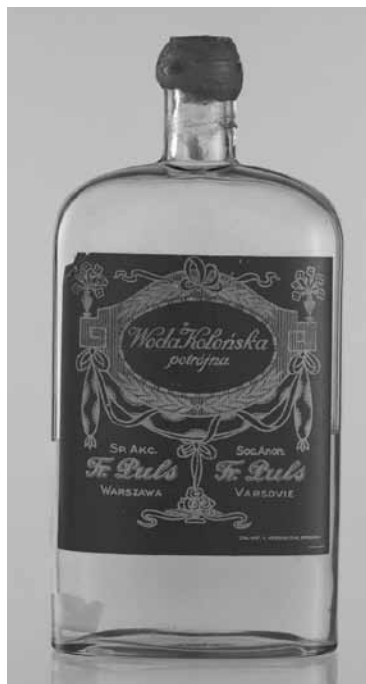
15. Butelka z wodą kolońską potrójną firmy Fryderyk Puls; lata 20.–30. XX w.; szkło, papier, zawartość; formowanie, druk, klejenie; wys. 19, dł. 9 cm; MHW 29100 / Fryderyk Puls triple eau de Cologne bottle; 1920s-1930s; glass, paper, contents; forming, print, glueing; height 19, length 9 cm; MHW 29100

ki nadszycane w etykietkach, bez alkoholu”: „Raczk”, „Złota Rybka”, „Gejsza” oraz „z pikantnym nadzieniem” – „Abricotine”. Papierki po cukierkach są najbardziej ulotnymi ze wszystkich, ze swej natury nietrwałymi, opakowań. Te najwcześniejsze rzadko dotrwały do naszych czasów i tym bardziej są cenne. W 2018 roku zakupiono także opakowanie, fioletowo-złote, po czekoladzie nadszycanej kremem irysowym (MHW 30512).