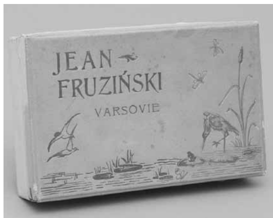
11. Pudełko firmowe firmy Jan Fruziński; autorstwo nieznanne, wytw. nieznaną, pocz. XX w.; tektura, papier; druk, wytłaczanie, klejenie, zszywanie, techniki introligatorskie; wys. 3,3, dł. 16, głęb. 10 cm; MHW 27286/a-b / Jan Fruziński company box; author unknown, producer unknown; early 20th c.; cardboard, paper, print, embossing, glueing, sewing, binding techniques; height 3.3, length 16, depth 10 cm; MHW 27286/a-b