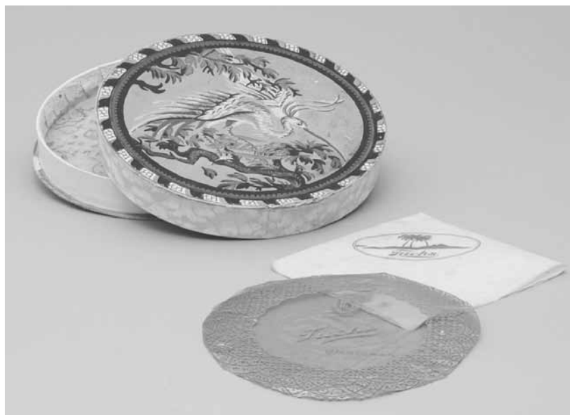
9. Bombonierka po czekoladkach firmy F. Fuchs; autorstwo nieznanne, wytw. nieznanne, przed 1931; tektura, papier, celofan, gwasz; druk, gwasz, klejenie, techniki introligatorskie; wys. 2,8, śr. 18,2 cm; MHW 25779/a-d / F. Fuchs chocolate box; author unknown, producer unknown, before 1931; cardboard, paper, cellophane, gouache, glueing, binding techniques; height 2.8, diameter 18.2 cm; MHW 25779/a-d

owalne z ilustracją przedstawiającą dzieci w strojach holenderskich (MHW 26269/a-c, dar osoby prywatnej z 2005 roku).