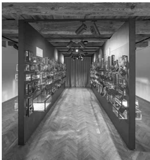
1. Widok Gabinetu Opakowań Firm Warszawskich na wystawie głównej Muzeum Warszawy (I zmiana) / View of the Room of Warsaw Packaging in the Museum of Warsaw core exhibition (series I)

senków. Istnieją muzea opakowań, lecz są to zazwyczaj instytucje prywatne, jak Muzeum Marek, Opakowań i Reklamy założone w 1984 roku w Londynie przez Roberta Opiego 2 . Opakowania są oczywiście gromadzone również przez muzea publiczne, choć rzadko stanowią odrębne kolekcje, raczej są uzupełnieniem innych zespołów muzealiów. Na przykład w Muzeum Narodowym w Krakowie tego typu przedmioty gromadzone są w ramach Działu Rzemiosła Artystycznego, Kultury Materialnej i Militariów, w poddziale varia. Warto wspomnieć, że znajduje się tam interesujący zbiór opakowaniowych warszawianów, szczególnie pudełek po słodyczach firm E. Wedel, Lardelli, Plutos. Muzeum Filumenistyczne w Bystrzycy Kłodzkiej w swojej kolekcji posiada ogromny zbiór opakowań zapalczanych, a Muzeum Piernika, oddział Muzeum Okręgowego w Toruniu, opakowania po tego typu wypiekach. Natomiast kolekcja opakowań po środkach leczniczych stanowi dużą część zbiorów Muzeum Farmacji im. mgr farm. Antoniny Leśniewskiej, oddziału Muzeum Warszawy. Coraz częściej pojawiają się jednak muzealne wystawy poświęcone opakowaniom – by wspomnieć przygotowaną wspólnie przez Centrum Sztuki i Kultury Japońskiej Manggha w Krakowie oraz Muzeum Azji i Pacyfiku w Warszawie, prezentującą współczesne dokonania na tym polu (2016–2017). Często praktyką jest także prezentacja tego rodzaju prywatnych kolekcji w muzeach.