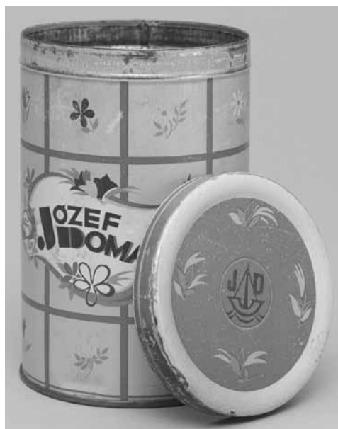
3. Pudełko po landrynkach firmy Józef Domański, Tadeusz Gronowski, wytw. nieznaną, 1934; metal, farby emaliowe; tłoczenie, lakierowanie, wyrób fabryczny; wys. 15,2, śr. 10 cm; MHW 22898/a-b / Fruit drop box, Józef Domański, Tadeusz Gronowski company, producer unknown, 1934; metal, enamel paint; embossing, coating, factory-made; height: 15.2, diameter: 10 cm; MHW 22898/a-b

szawskiej wytwórczości (opakowania są nierzadko jedynym źródłem wiedzy o wielu warszawskich firmach) oraz względy artystyczne i estetyczne. Powstająca niejako na marginesie głównych zainteresowań muzealników, jednak z emocjonalnym zaangażowaniem, kolekcja z czasem stała się pełnoprawnym, autonomicznym zbiorem, prezentowanym na stałej ekspozycji. Ze względu na stosunkowo niewielką wartość materialną obiektów, wiele z nich zostało pozyskanych jako dary. Teraz historyczne opakowania, coraz częściej będące przedmiotem zainteresowania rynku sztuki, są włączane do muzealnej kolekcji także w wyniku zakupów.