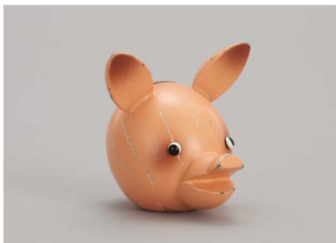
Zabawki-opakowania wykonane w wytwórni Edwarda Manitiusa w latach 1926–1939, Muzeum Warszawy