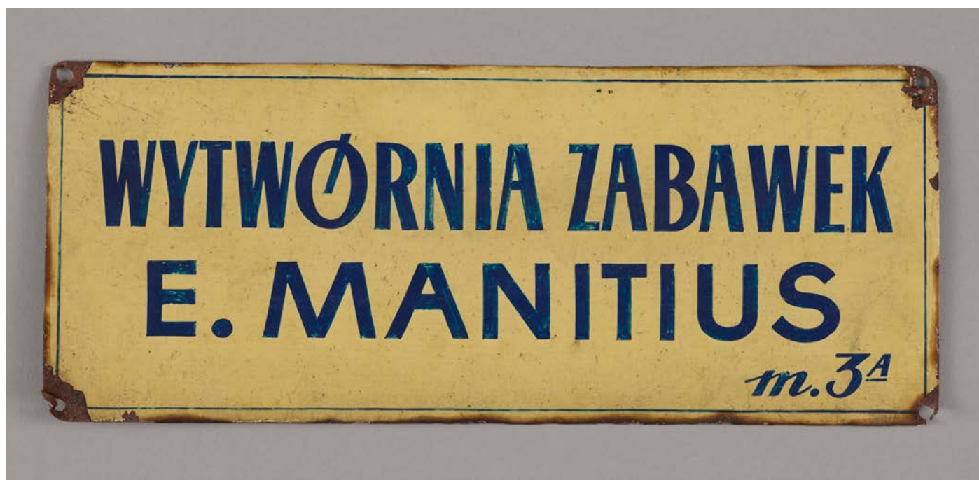
Szyld wytwórni, 1956-1975