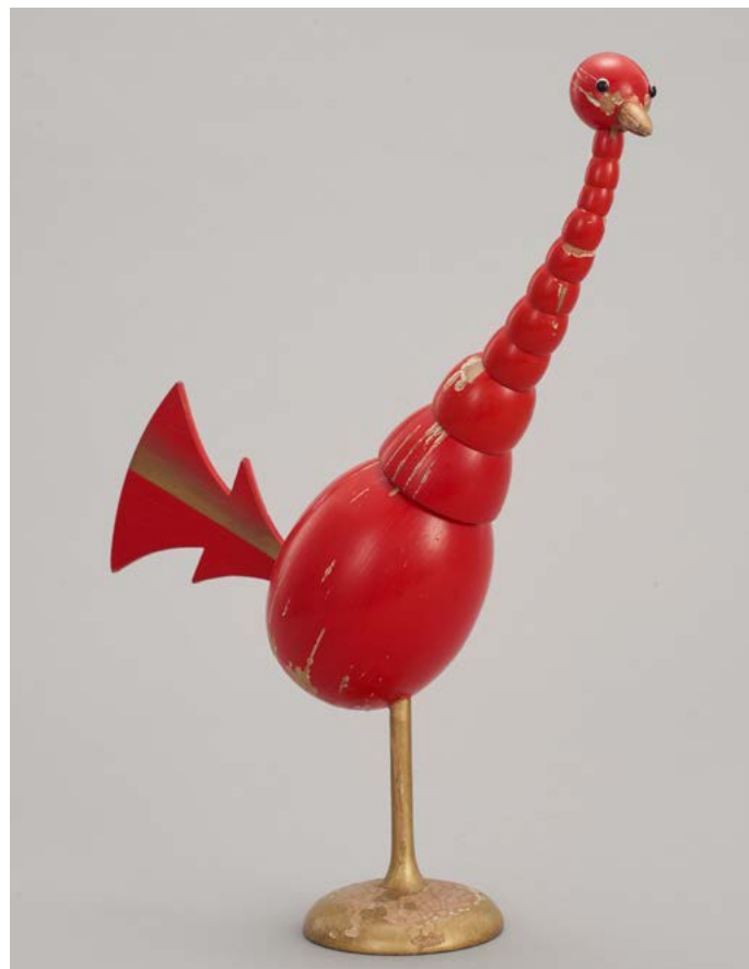
Zabawki-opakowania wykonane w wytwórni Edwarda Manitusia w latach 1926–1939, Muzeum Warszawy