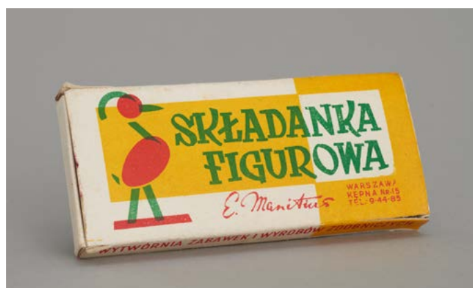
Składanka figurowa, lata 60.–70. XX w

Pliki w wysokiej rozdzielczości przeznaczone do publikacji znajdują się w zakładce: muzeumwarszawy.pl/dla-mediow/