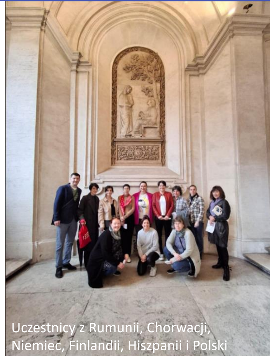
Uczestnicy z Rumunii, Chorwacji, Niemiec, Finlandii, Hiszpanii i Polski